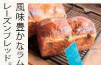
風味豊かなラム・レーズンブレッド。