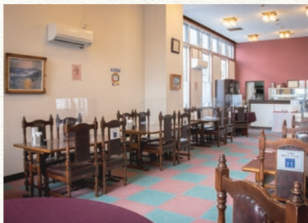
ホテルロビーに隣接したレストラン。