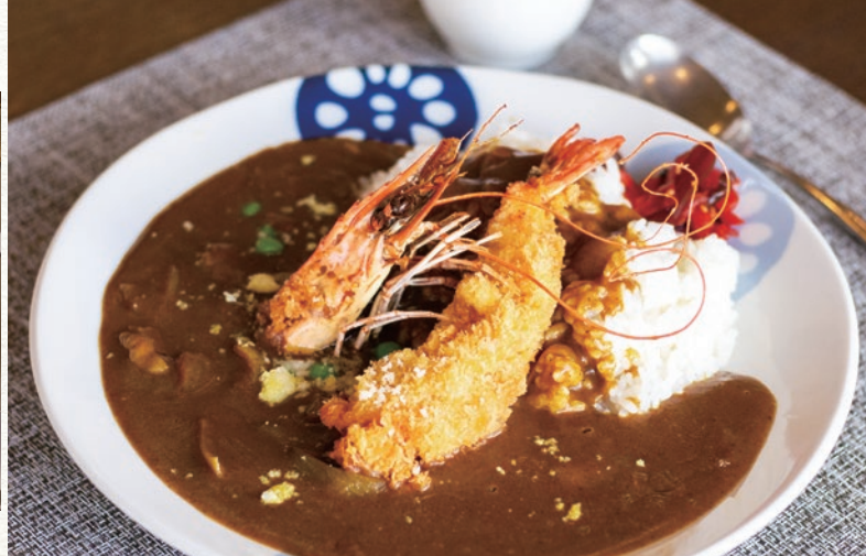
津花館特製のカレールーを使用した「車海老カレー」。

日本海とかもめ島を一望できるロケーション。 磨き上げたシェフの技が生きるメニューです。