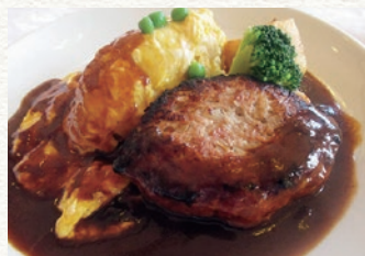
人気のオムライスをハンバーグと一緒に。

テイクアウトメニューも充実していますので、日常のお食事やホームパーティーなどに便利です。