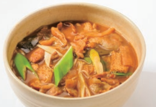
体が温まる冬季限定の「カレー南そば」。