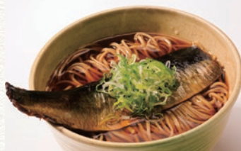
和味特製のニシン甘露煮を使用した「にしんそば」。仕込みのタイミングで提供できない場合もありますので、電話にて確認下さい。

町内で手打ちそばが食べられる唯一のお店で、本当に美味しい蕎麦が食べられます。観光シーズンではない11月～3月が比較的すいているのでお勧め。