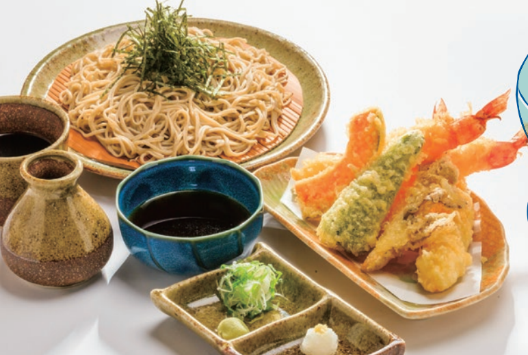
大きい海老を使用し、食べ応えのある「海老天ざる」。