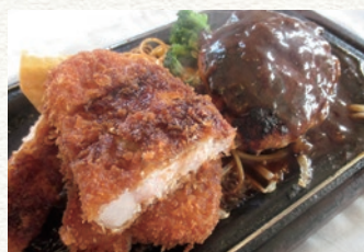
ロースカツとハンバーグの盛り合わせでボリューム満点。そのほか、和食メニューも充実しています。