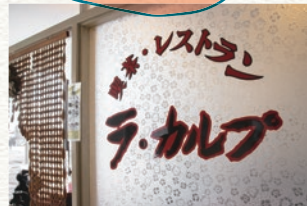
看板メニューの「あんかけ焼きそば」は時代を越えて愛され続けています。