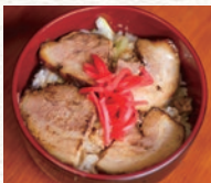
柔らかい厚切りチャーシューの「チャーシュー丼」。