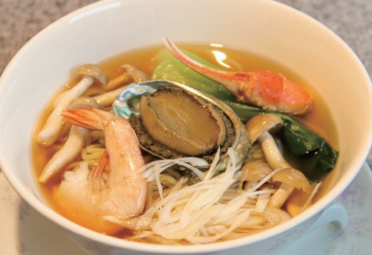
柔らかく煮た丸々1個のアワビやエビ・カニなどが入った「海の幸ラーメン」。